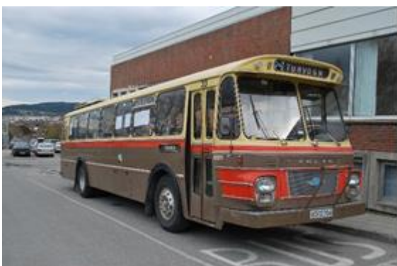
XD 12704 Fylkesbussen