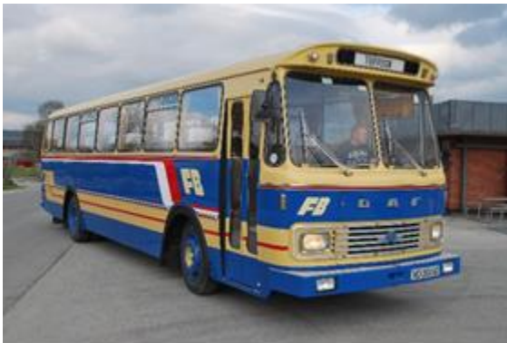
XD 30047 Fjerdingsgen