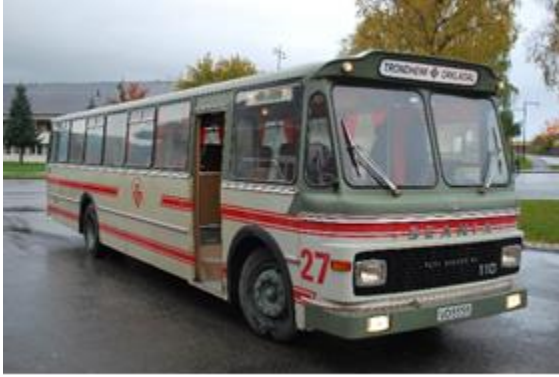
VD-55511 TOB 27