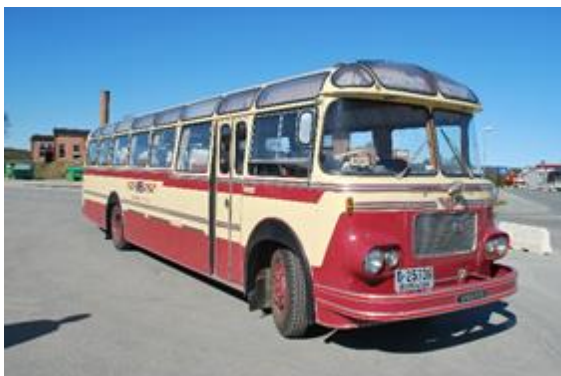
D-25736 Hokstad vogna