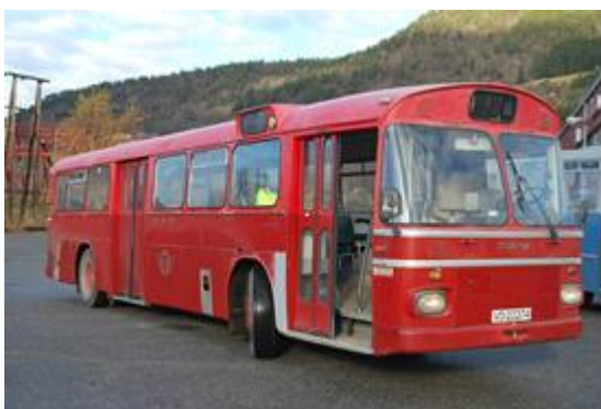
VD 22274 TBR